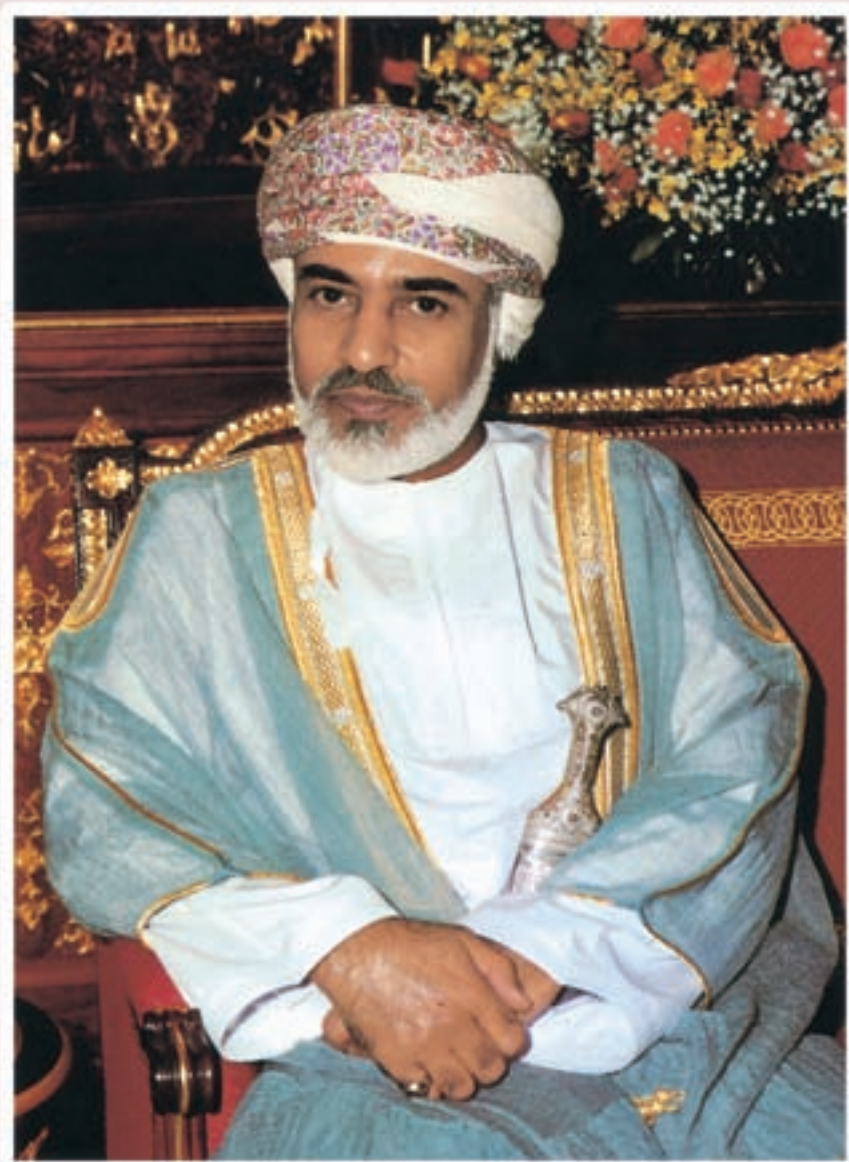
حضرة صاحب الجلالة السلطان قابوس بن سعيد المعظم