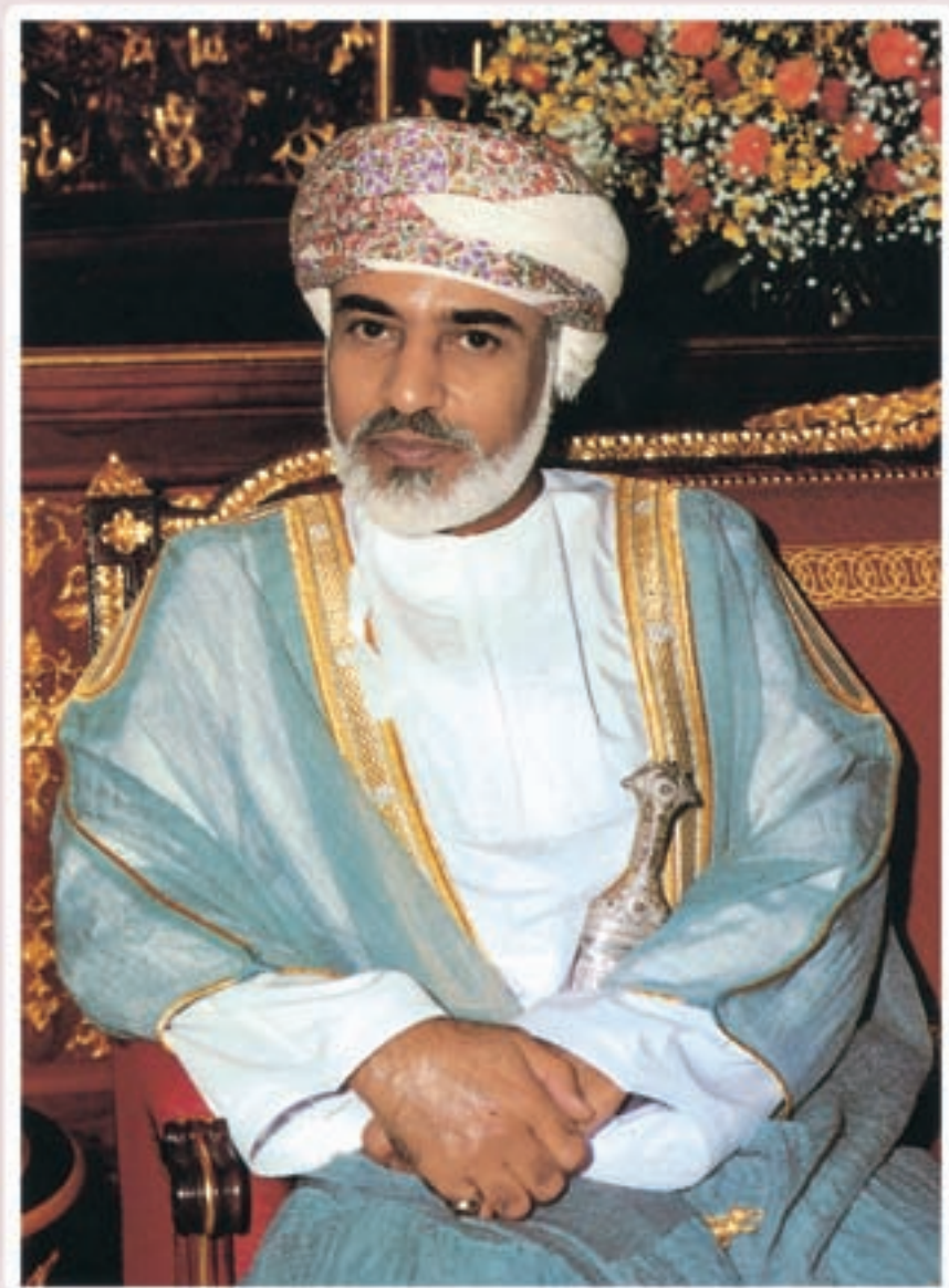
His Majesty Sultan Qaboos Bin Said