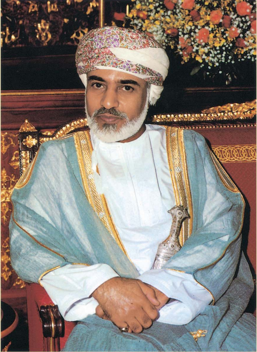
حضرة صاحب الجلالة السلطان قابوس بن سعيد المعظم