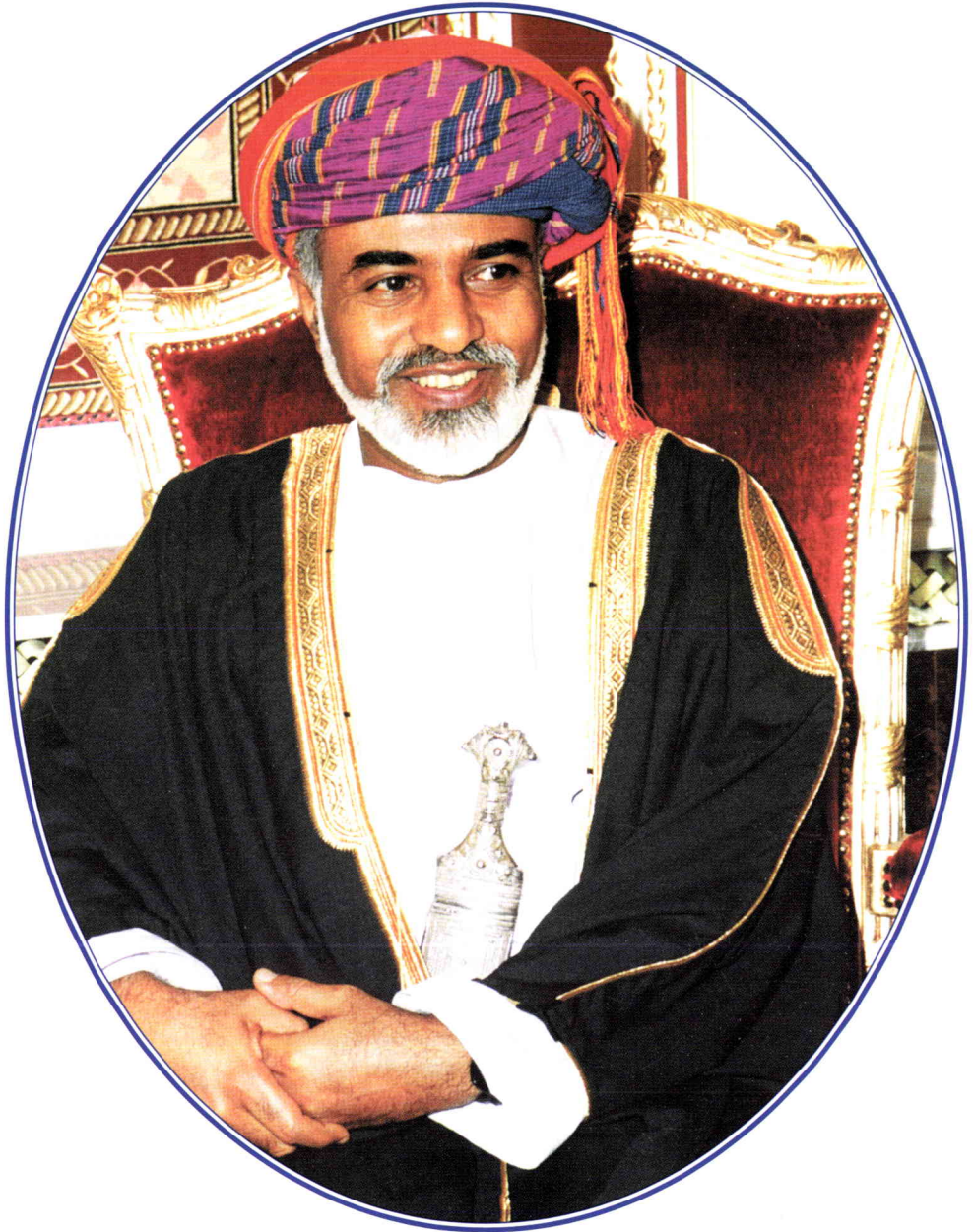
حضرة صاحب الجلالة السلطان قابوس بن سعيد المعظم